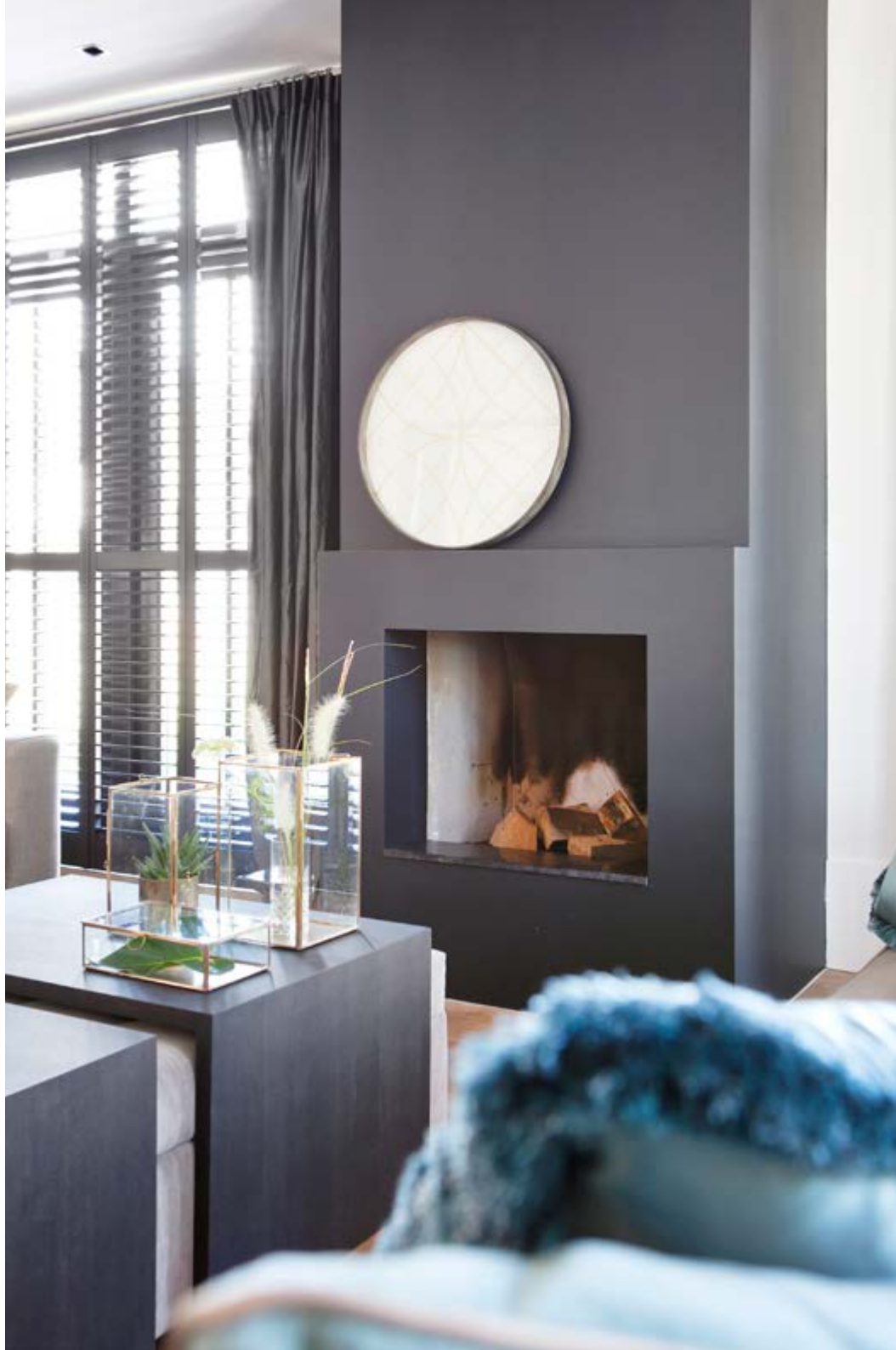
Sofa (model Spoom) en de poef met overzettafels zijn van Keijser&Co. De kussens op de sofa zijn van Claudi, de gordijnen zijn geleverd door het atelier waar interieurontwerpster Arianne mee samenwerkt. Op het dressoir staan accessoires van Muubs (alles via Pronkstuk). De schouw is geïnstalleerd door Nico Schouw in Bergschenhoek, de shutters zijn van Jasno.