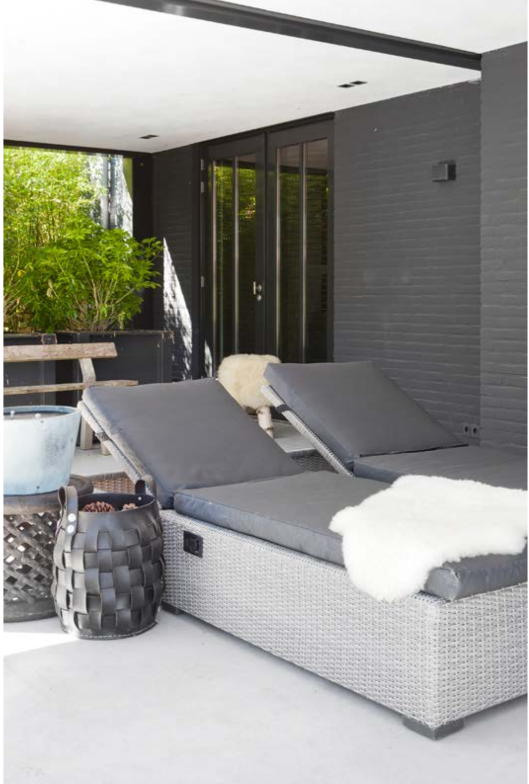
Loungehoek op het terras met ligbedden van een lokale winkel, de kaars is van Dekocandle.